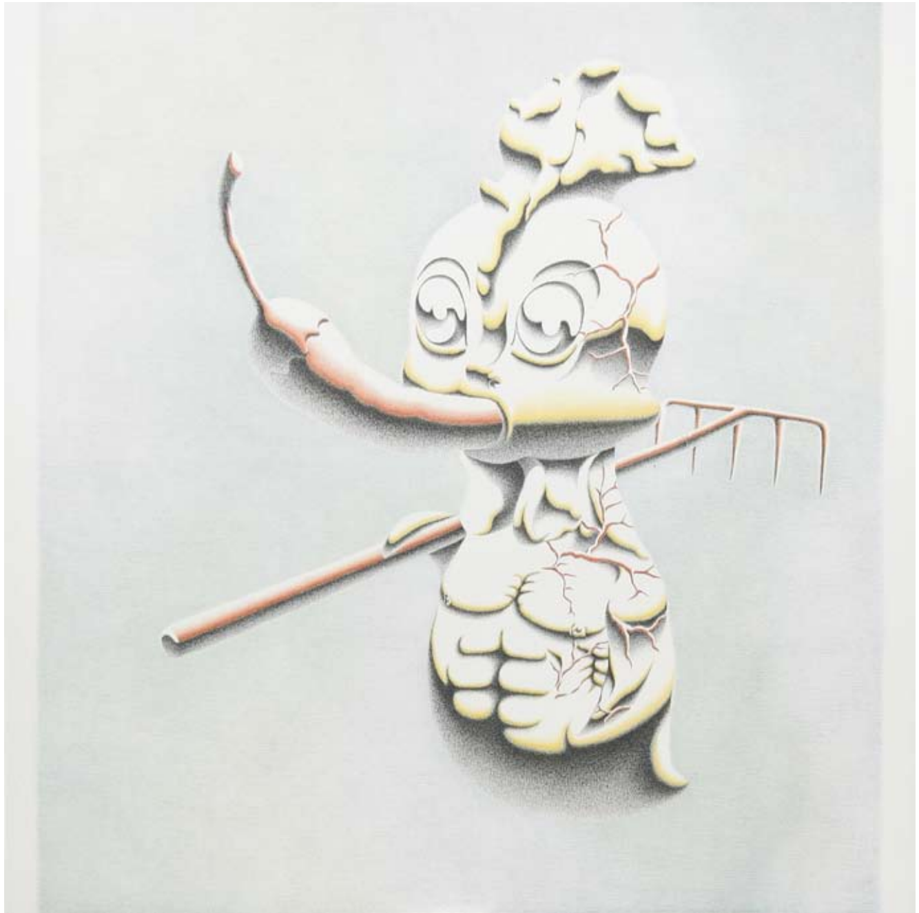
Born To Be Hard Worker charcoal pencil, colour pencil on canvas 150 x 150 cm 2009