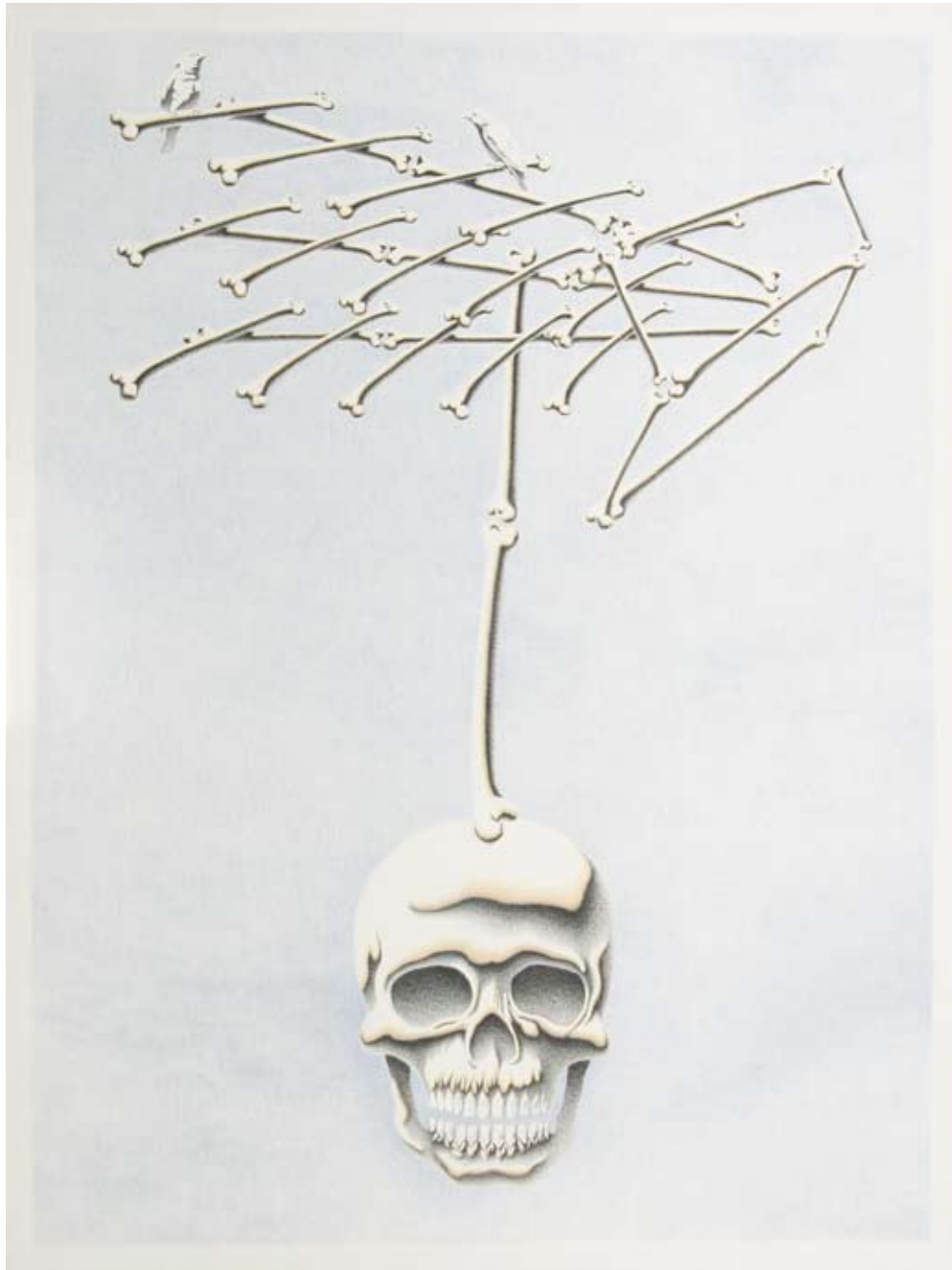
Diposono Channel charcoal pencil, colour pencil on canvas 200 x 150 2009