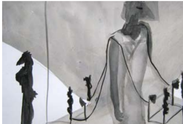
Mella Jaarsma - Square Body variables dimension mix media 2009