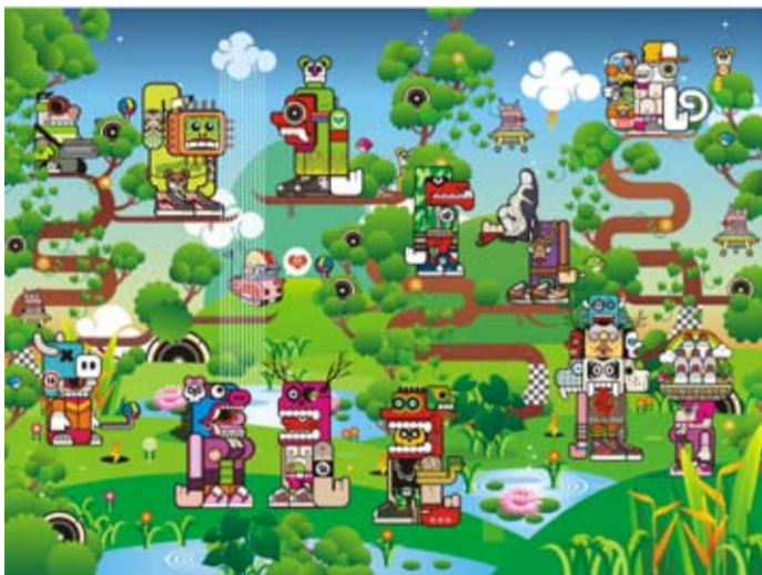
Indieguerillas - Royal Malfunction: A Compliment from The Parasite Animasi 4 menit