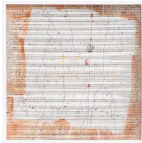
Lenny Ratnasari Weichert - Axis Imaginer I 100 x 100 cm; threading sewing on canvas, acrylic stick 2009