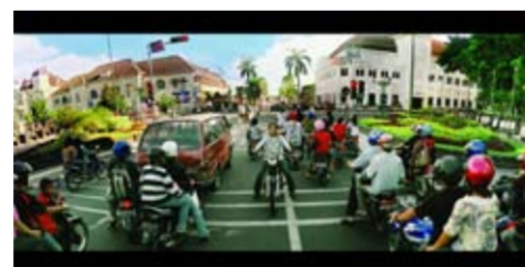
MES 56 - 2nd Pose I Yusra Martunus - Pelukis variables 2009