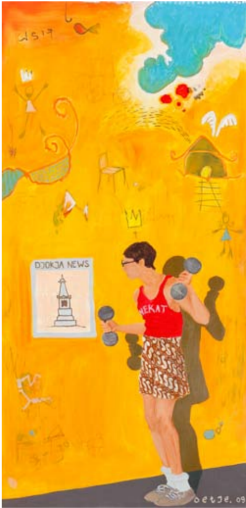
Oetje - Keep Fight For Jogja 185 x 90 cm; acrylic on canvas 2009