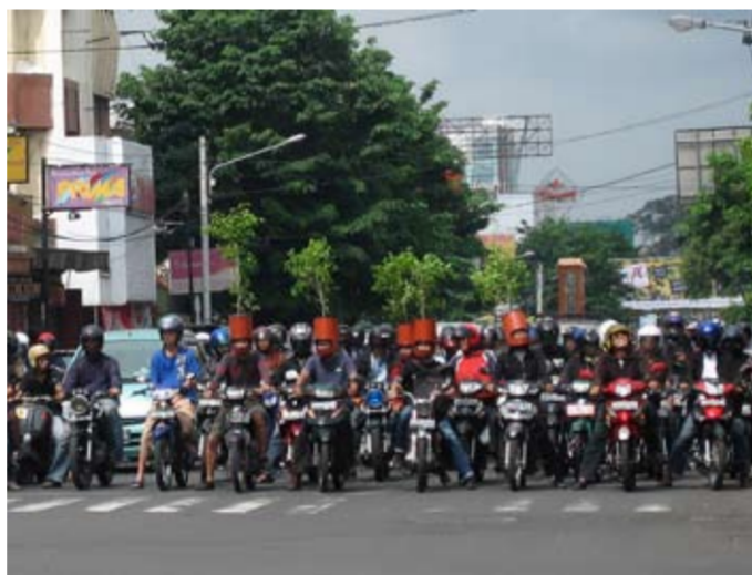
Arya-Sara - "TREEBUTE to Jogja" (intervention in a public space) variables mixmedia 2009