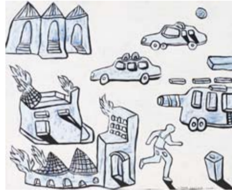
Imam Santosa - Mencari Air di Kotak Sampah 100 x 120 cm; acrylic on canvas 2009