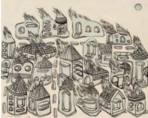
Imam Santosa - Mudah terbakar 120 x 150 cm; acrylic on canvas 2009