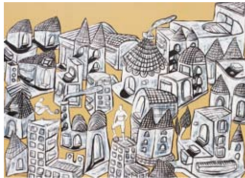
Imam Santosa - Sudah Sempit 140 x 200 cm; acrylic on canvas 2009