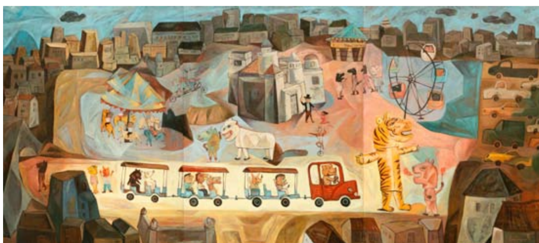
Marsoyo - Hegemoni Pasar 200 x 450 cm; (triptych) acrylic on canvas 2009