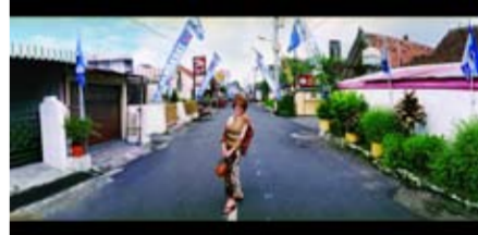
MES 56 - 2nd Pose Midori Hirota – Pelukis variables 2009