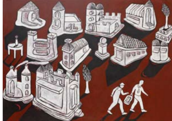
Imam Santosa - Membangun dan Meninggalkan 140 x 200 cm; acrylic on canvas 2009