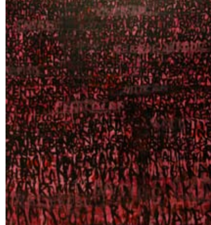
Agus Baqul - Jalan-Jalan 200 x 180 cm; acrylic on canvas 2009