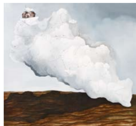
Heri Purwanto - Dream Land 140 x 150 cm; acrylic on canvas 2009