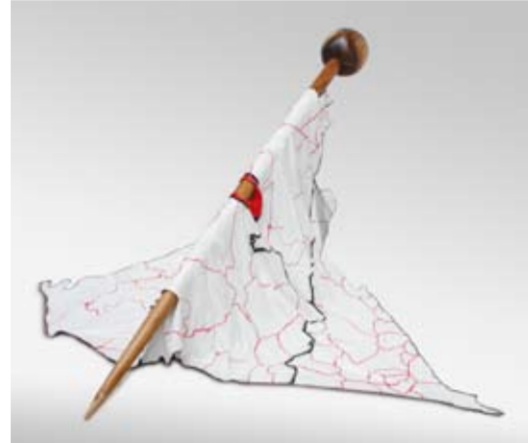
Lenny Ratnasari Weichert - Axis Imaginer II 150 x 100 x 100 cm; wood, painted fiber 2009