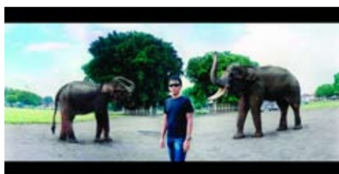
MES 56 - 2nd Pose I Nyoman Masriadi - Pelukis variables 2009