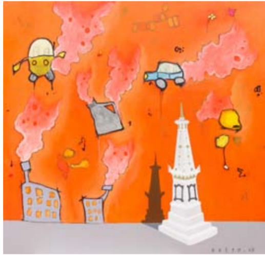
Oetje - Jogja Smokers 140 x 150 cm; acrylic on canvas 2009