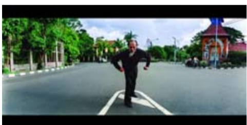
MES 56 - 2nd Pose Djoko Pekik - Pelukis variables 2009