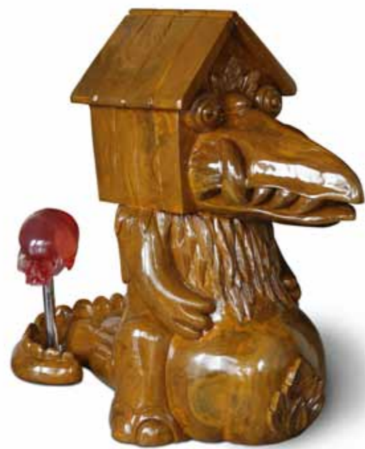
Peasant Hospitality teak wood, stainless steel, resin 100 x 45 x 85 cm 2010