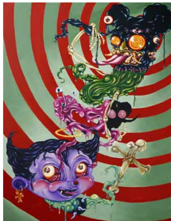
Scat Love Among Us acrylic on canvas 195 x 150 cm 2010