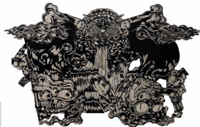
Domestic Harsh Affair printing ink on mdf 242 x 150 cm 2010